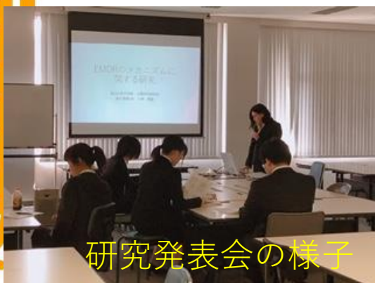
研究発表会の様子

※募集要項を配布しますので、受験を検討中の4年生（飛び級希望の3年生）は全員参加してください。その他、大学院に関心のある1・2年生も是非参加してください。学外からの参加もお待ちしております！